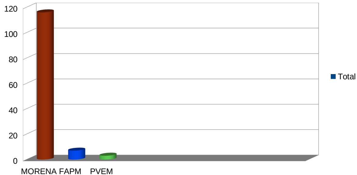
Gráfica 1. Desagregado por partido o coalición

Indicadores cuantitativos: Los indicadores cuantitativos (es decir, objetivamente verificables) se refieren a las características que pueden determinarse de forma fiable.